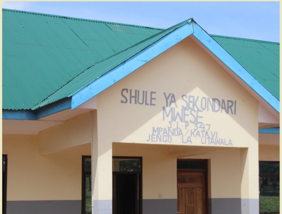
Jengo la Utawala la Shule ya Sekondari Mwese, iliyopo katika Kata ya Mwese, H/W ya Tanganyika.

• Idadi ya matundu ya vyoo imeongezeka kutoka