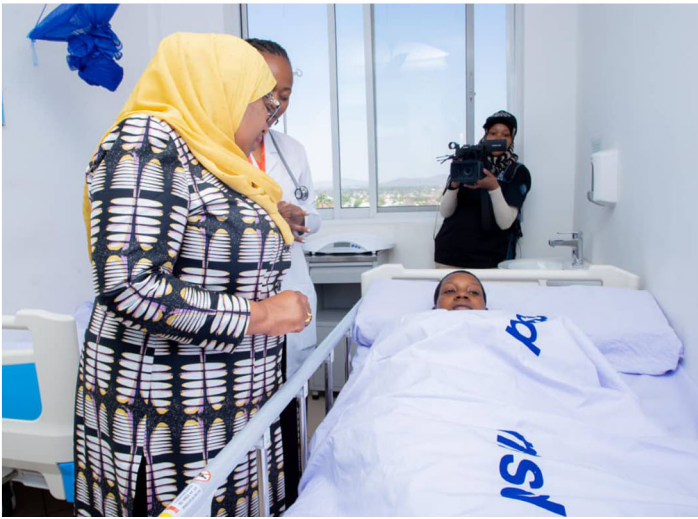
Rais wa JMT, Mhe. Rais Dkt. Samia Suluhu Hassan akimjulua hali mgonjwa katika Hospitali ya Rufaa ya Mkoa Katavi.