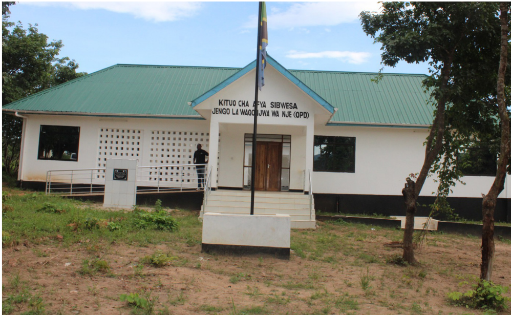
Kituo cha Afya Sibwesa kilichopo Kata ya Sibwesa Tarafa ya Mwese, H/W ya Tanganyika.