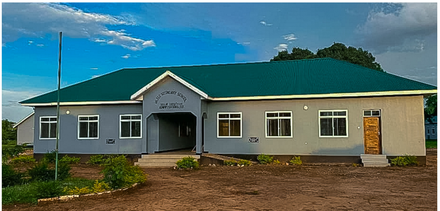
Shule ya Sekondari Mlele iliyopo Kata ya Inyonga, H/W ya Mlele

• Idadi ya matundu ya vyoo imeongezeka kutoka matundu ya vyoo 1,669 mwaka 2021 hadi kufikia matundu ya vyoo 4,403 sawa na ongezeko la matundu ya vyoo 2,734 .