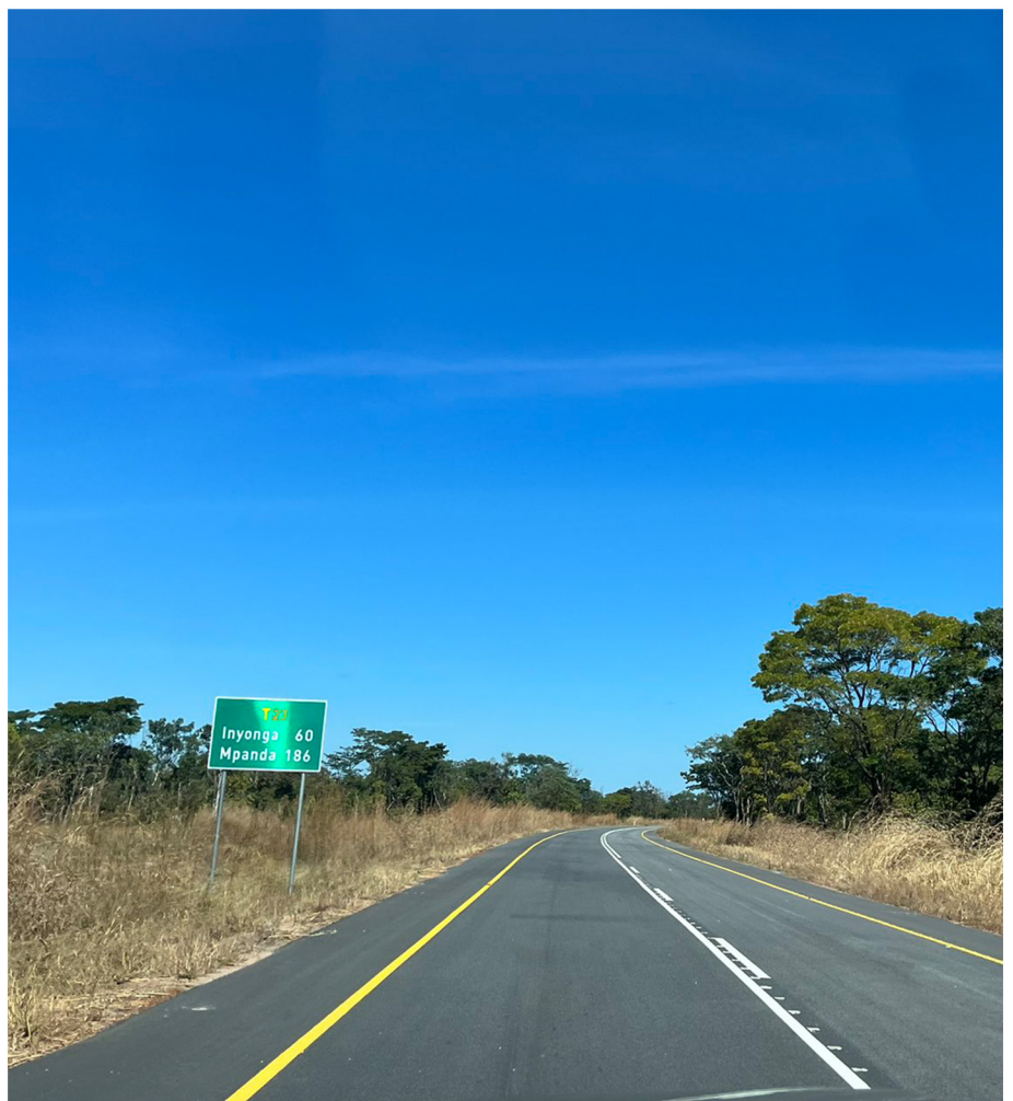
Barabara yenye kiwango cha lami Katavi - Tabora

• Barabara ya Mpanda - Uvinza - Kanyani (km 250.44) sehemu ya 3: luhafwe - Mishamo