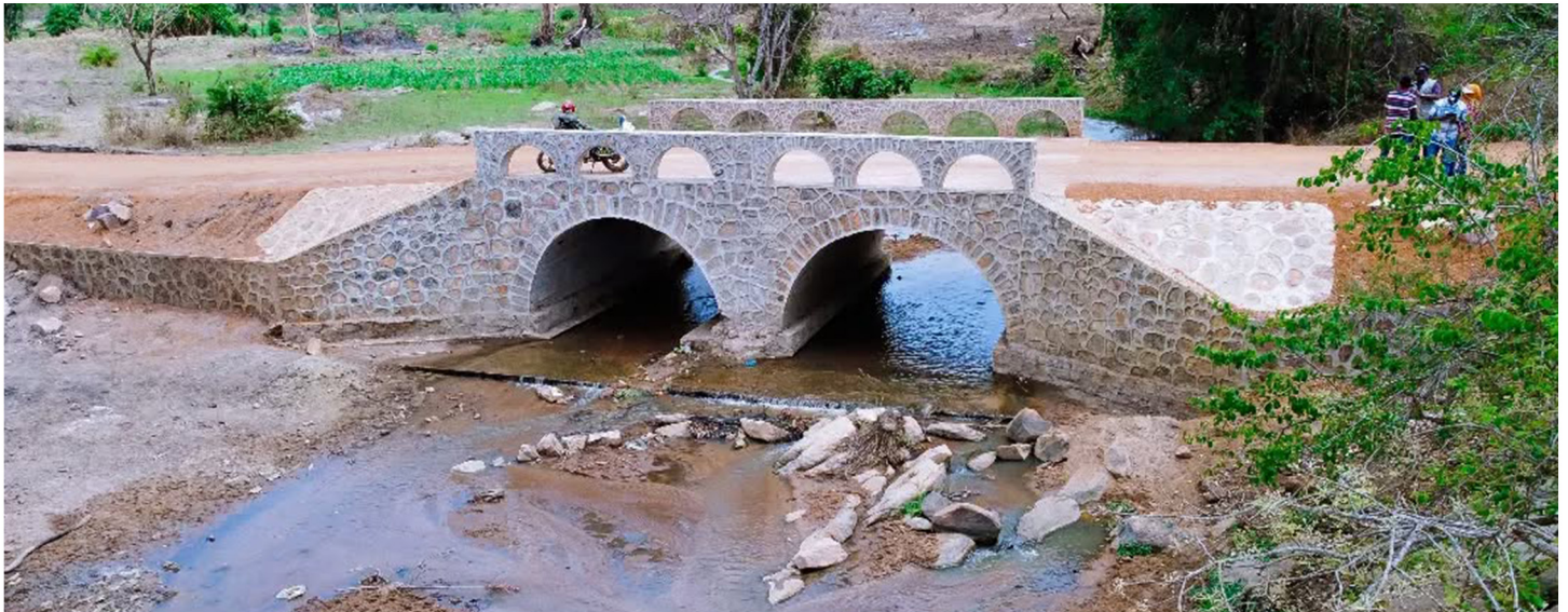
Daraja la Mto Mwali linalounganisha Vijiji vya Nyagantambo, Bungwe na Ifinsi.