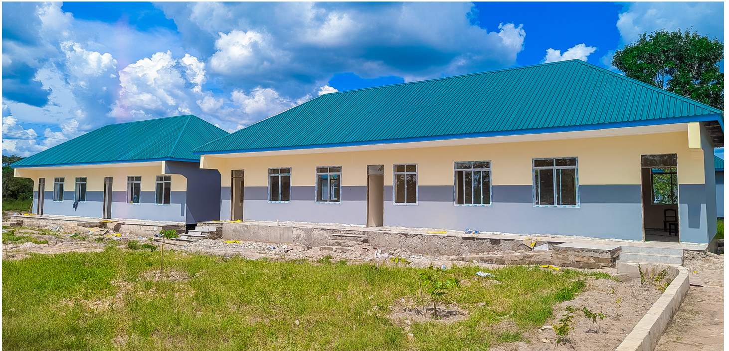
Maendeleo ya Ujenzi wa Shule ya Sekondari ya Wavulana Katavi

Kwa kipindi cha uongozi wa Rais wa awamu ya sita, Sekta ya Elimu imepokea kiasi cha Shilingi 57,870,265,268.7 (Bilioni 57.870) zilizotumika katika kuboresha miundombinu ya Shule mbalimbali na kuweka mazingira mazuri ya kufundishia na kujifunza pamoja na Ujenzi wa Shule mpya mia moja ishirini na tisa (129) zikiwemo Shule 97 za Msingi na Shule 32 za Sekondari, madarasa 689, madarasa ya awali 6, matundu ya vyoo 112. Hii imepunguza kwa kiasi kikubwa umbali wa kutembea kwenda Shule na msongamano wa Wanafunzi madarasani na kuwezesha mazingira bora zaidi kwa Walimu na Wanafunzi.