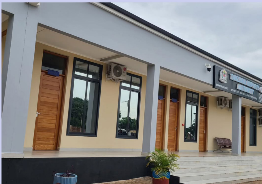
Jengo jipya la abiria uwanja wa ndege Mpanda

Mkoa una huduma ya uhakika ya usafiri wa anga kati ya Mpanda na Dar - Es- Salaam ambao unafanywa mara tatu (3) Siku za Jumatatu, Alhamisi na Jumamosi kwa wiki kupitia Shirika la Ndege la Tanzania (ATC). Uwepo wa uhakika wa safari za ndege kupitia shirika hili, unarahisisha kwa kiwango kikubwa mawasiliano na kuimarisha Shughuli za kiuchumi na kijamii kwa wananchi wa Mkoa wa Katavi. Mkoa umepokea Shilingi 1,444,617,687.63 (Bilioni 1.444) kwa ajili ya kuendelea na maboresho ya Uwanja wa Ndege Mpanda katika ujenzi wa jengo la utawala.