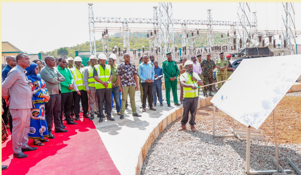
Naibu Waziri Mkuu na Waziri wa Nishati, Mhe. Doto Biteko akipata maelezo ya kitaalamu kuhusu mradi wa njia ya kusafirisha umeme kutoka Tabora hadi Mpanda pamoja na ujenzi wa kituo cha kupokea, kupoza na kusambaza umeme cha Inyonga, Mlele Katavi.

Mradi utakamilika tarehe 04.09.2026 , hatua ya mradi ipo kwenye usanifu na ununuzi wa vifaa.