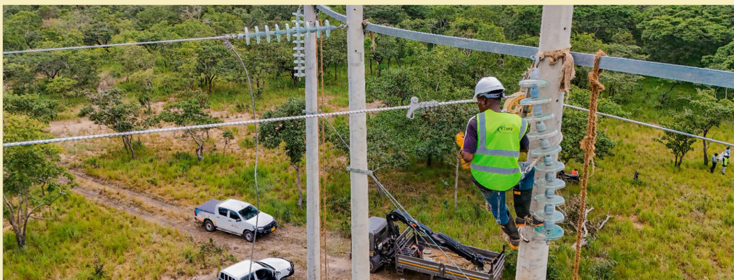
Wafanyakazi wa Kampuni ya Ujenzi na Ukarabati wa Miundombinu ya Usafirishaji na Usambazaji Umeme (ETDCO) wakiwa kazini wakitekeleza mradi wa ujenzi wa njia ya kusafirisha umeme kutoka Mkoa wa Tabora hadi Katavi.