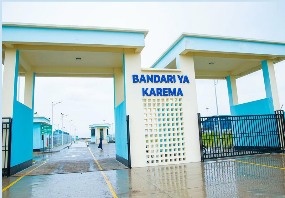
Tenki la Maji lenye ujazo wa lita 100,000 lililopo katika Kata ya Kanoge, H/W ya Nsimbo.

Bandari hii imerahisisha usafirishaji wa abiria na mizigo ambao umeboresha kufanyika kwa biashara baina ya Tanzania na nchi jirani za Congo DRC, Rwanda, Zambia na Burundi na kukuza uchumi wa Mkoa wa Katavi na Nchi kwa ujumla.