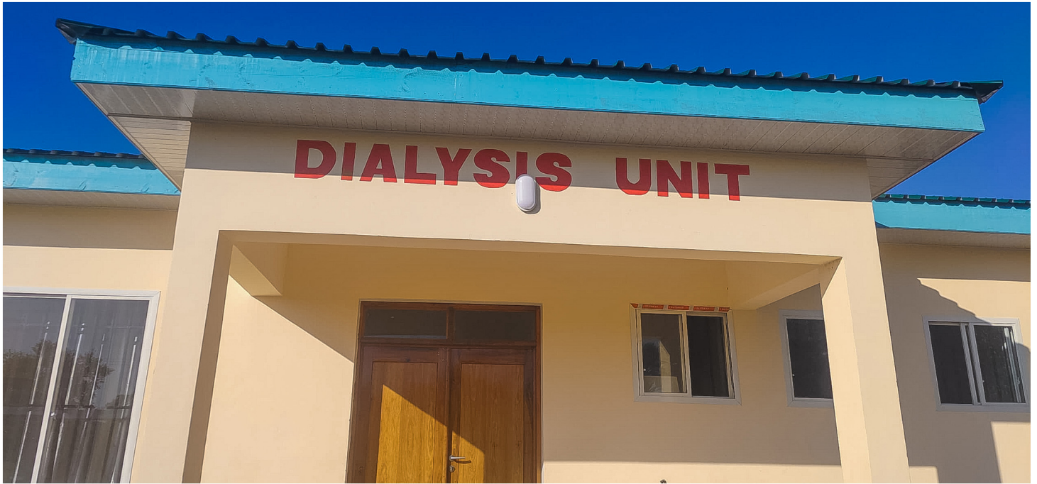
Jengo la ‘Dialysis’ (Huduma ya kusafisha Damu) Hospitali ya Rufaa ya Mkoa wa Katavi

kibingwa za Magonjwa ya Ndani pamoja na huduma za kibingwa za magonjwa ya dharura.