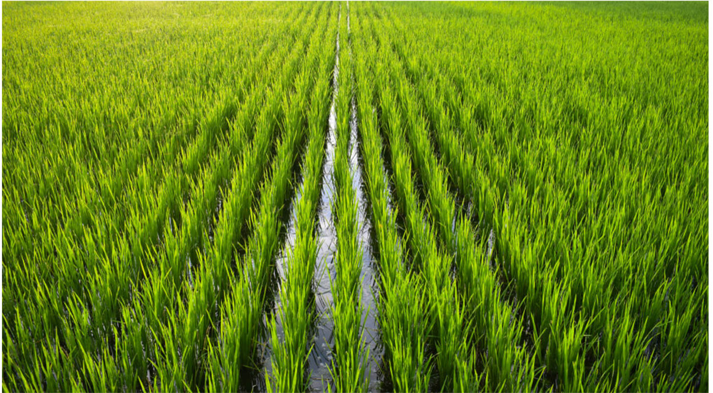
Misitu ya Asili H/W ya Tanganyika