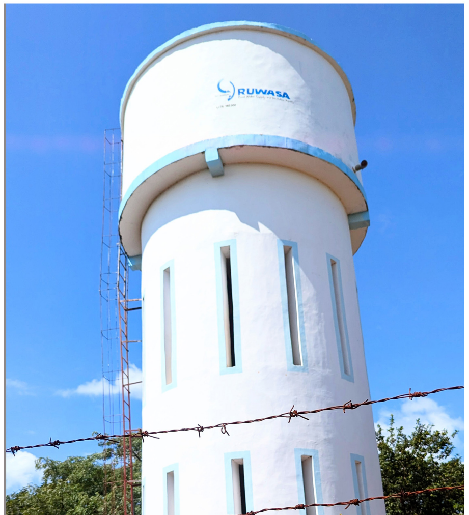
Tenki la Maji lenye ujazo wa lita 100,000 lililopo katika Kata ya Kanoge, H/W ya Nsimbo

33,529,634,479.08 (Bilioni 33.352) kwa ajili ya miradi 51 ya Maji vijijini. Utekelezaji wa miradi hii imesaidia kuongeza idadi ya watumiaji wa Maji vijijini kutoka asilimia 62.2 mwaka 2021 hadi kufikia asilimia 77.3 Machi, 2025 sawa na ongezeko la asilimia 15.1