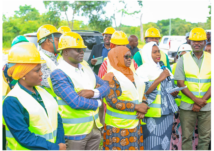
Kamati ya kudumu ya bunge ya TAMISEMI ilipokagua mradi wa ujenzi shule ya sekondari ya wavulana katavi.